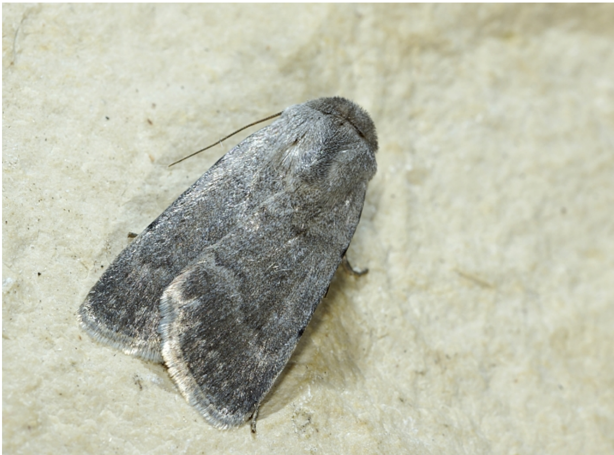
Abb. 1: Caradrina gilva (DONZEL, 1837): Berlin-Staaken, 5.VI.2014, Lichtfang

Die vorderasiatisch-mediterran verbreitete und bislang als xero-montan eingestufte Eulenart Caradrina gilva (DONZEL, 1837) (FIBIGER & HACKER, 2007) hat im Rahmen ihrer nordwärts gerichteten Expansion (STEINER, 1995) nun auch das Berliner Stadtgebiet erreicht. Der Erstautor fand in der Nacht vom 5. zum 6. Juni 2014 an einer hellen Wand neben der Lichtfanganlage einen frischen Falter (Abb. 1). Es handelt sich um den ersten Nachweis für Berlin und somit für die gesamte Region Berlin-Brandenburg.